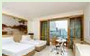
グランドセンターポイント・プルン チット(スーペリアバルコニー)