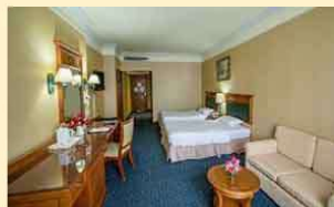
ロイヤルベンジャ (部屋指定なし)