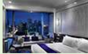
グランドセンターポイント・ スクンビット55(シングネチャー デラックス)