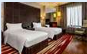
ヒルトングランデアソーク (デラックス)