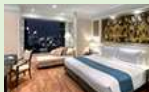
グランドセンターポイント ラチャダムリ(グランドデラックス)