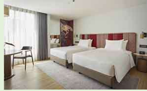
モンティエンホテル・スラウオン (デラックスルーム)