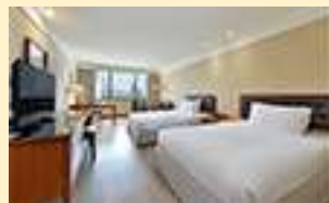
ツインタワーズ (スーペリアルーム)