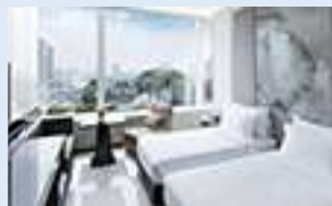
グランドセンターポイント・ターミナ ル21(デラックスプレミアム)