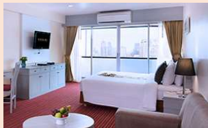
フラマーシーロム (スーペリアルーム)