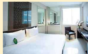
マンダリン・バイ・センター ポイント(デラックスルーム)