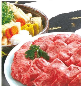
黒毛和牛すき焼き