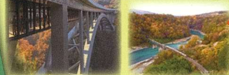
天空にそびえる孤高の橋 天龍峡大橋