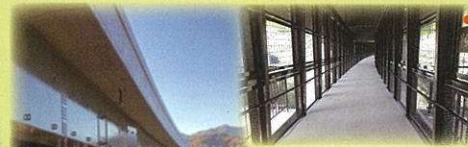
そらさんぽ天龍峡 (天龍峡大橋)