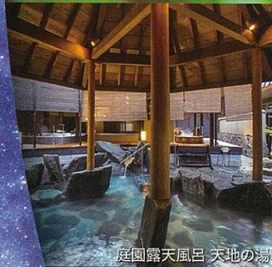
庭園露天風呂 天地の湯