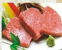
信州プレミアム牛ステーキ