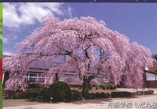
杵原学校 したれ桜