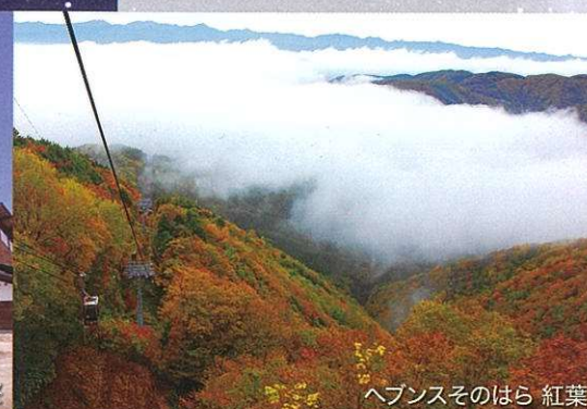
ヘブンスそのはら 紅葉