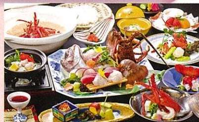
※写真の舟盛りは3名様盛りです。