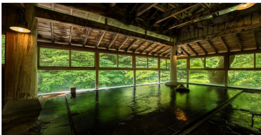
鷹泉閣 岩松旅館 女性専用清流風呂 香華の湯

宿泊者は、19:30～21:00まで、翌朝5:30～7:00までの女性専用時間に利用すれば安心。また、女性専用清流風呂 香華の湯(半露天風呂)では、混浴風呂と同様に清流を楽しめます。