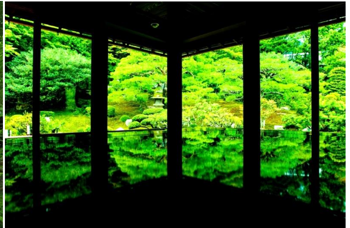
○夏の特別公開！青に染まる教林坊の苔庭は必見！