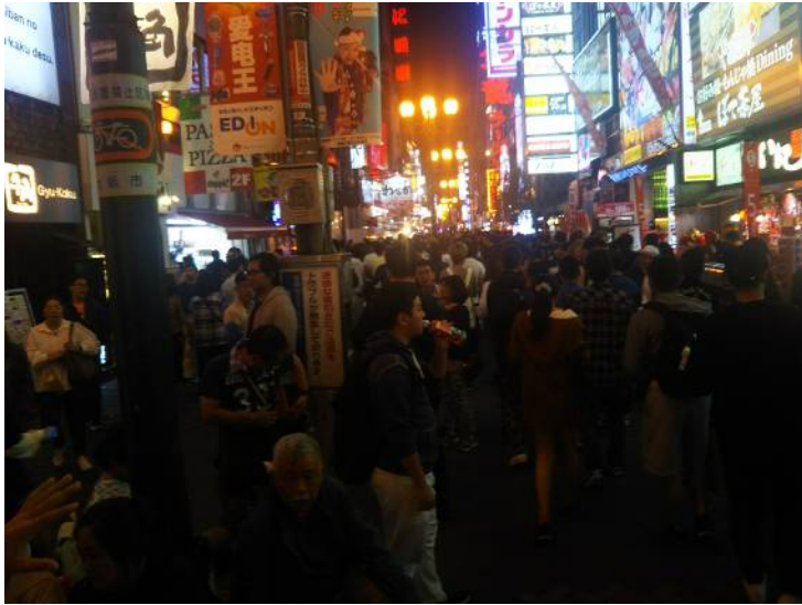
80%は外人のような気がする。。ヤバイ