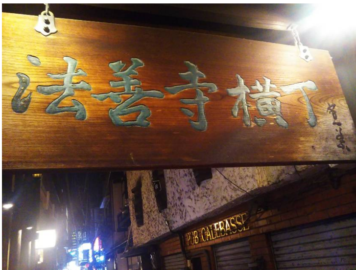
看板が昭和を感じさせます！！