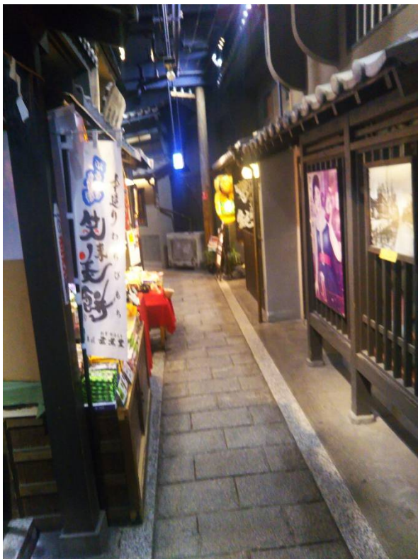
歌に名高い 法善寺横丁。。。